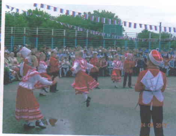
Выступление казачат на празднике