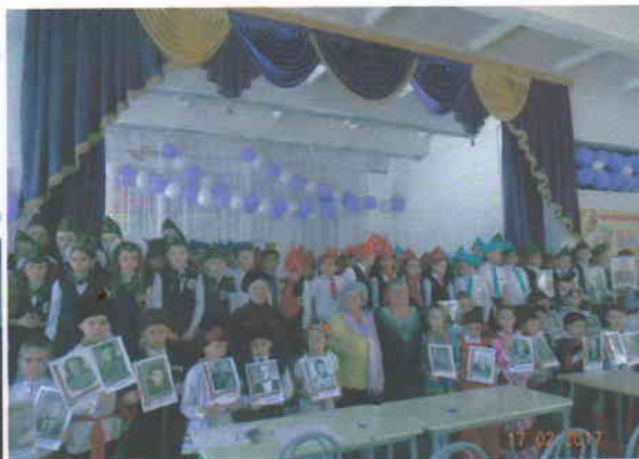
Конкурс инсценированной песни «Песня в солдатской шинели» Казачий класс.