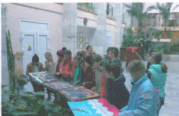
Поездка в Дом-музей Степановых г. Тимашевск с заездом в казачий хутор.