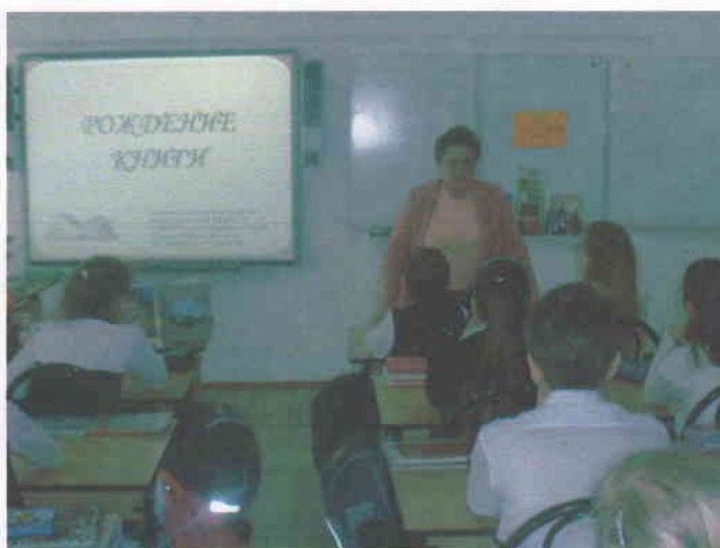
Неделя православной книги.