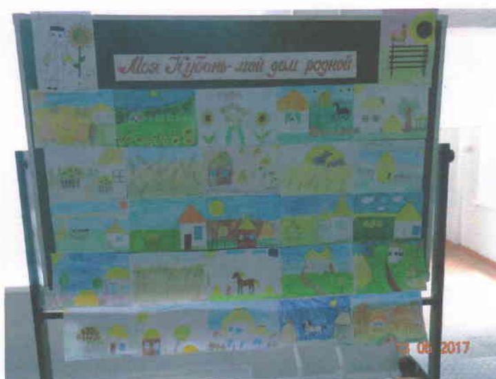
Выставки детских рисунков ко всем православным и патриотическим мероприятиям