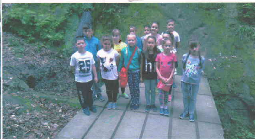
Паломническая поездка в г. Горячий Ключ Дантово ущелье