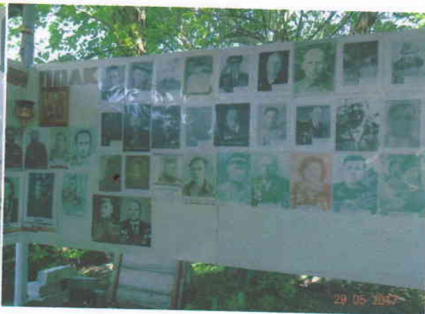
Сбор фотографий на стенд «Бессмертный полк» и материалов для издания «Книги Памяти»